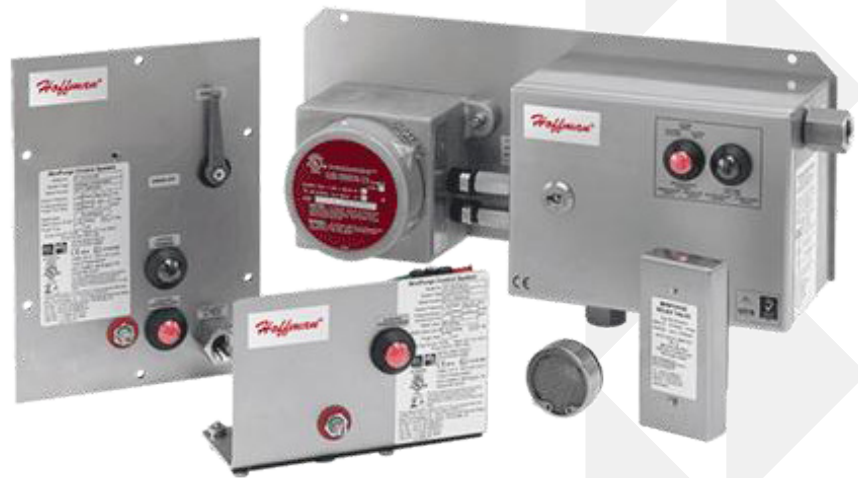
Sistemas de purga y presurización

peligroso o polvo. Esto separa cualquier material explosivo o riesgoso del equipo interno energizado. NFPA requiere una columna de agua con una presión mínima de 0.1 pulgadas (25Pa) para aplicaciones Clase I y II mientras que IEC / ATEX solicita una presión mínima de 50 Pa para los tipo X y Y y de 25 Pa para los tipo Z.