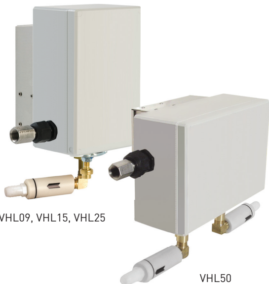
VHL09, VHL15, VHL25